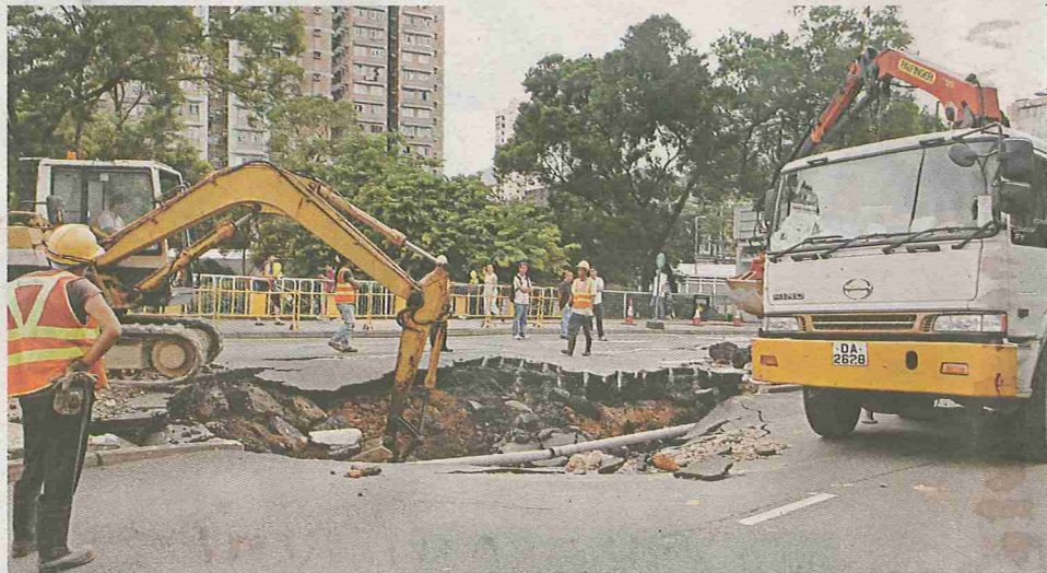
■ 寶鄉街爆水管路陷，令附近交通大受影響。

譚稱，當局在區議會會議上曾承諾，二〇一一年前更換大埔區內主要食水管，希望能加快工程進度。